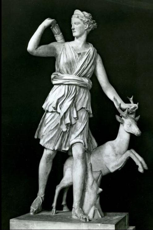
Artemis Göttin der Jagd, Wohlstand, Fruchtbarkeit