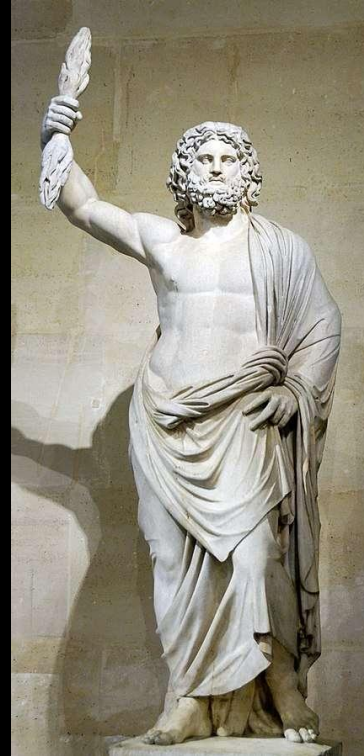
Jupiter bei den Römern und Zeus bei den Griechen: Oberster Gott im Olypm. Gott des Himmels und des Donners